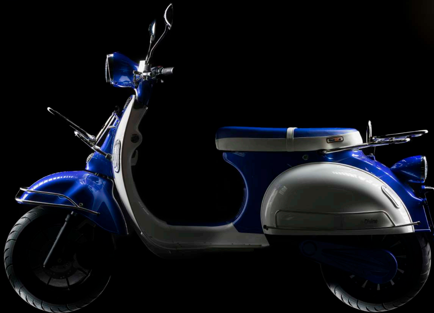
QuaZZar eDivine Plus 4.000 watts